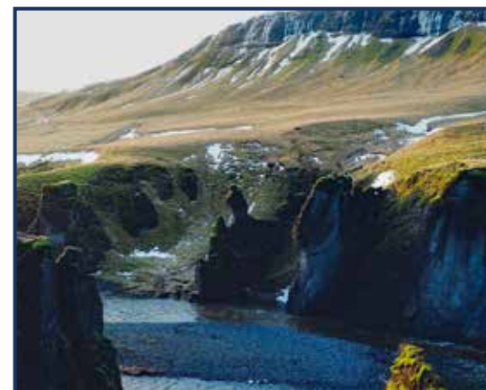
Zuid-Amerikaanse zeebeer - zee en strand