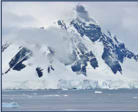
Ijsbeer - IJsschotsen en water