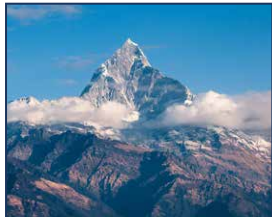
Rode panda - Himalaya - bergrotsen met sneeuw