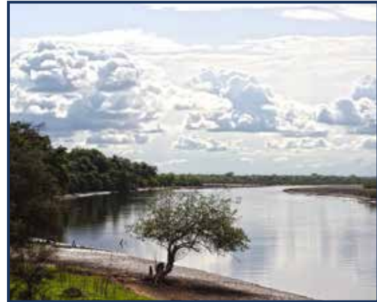
Nijlkrokodil - Afrika - rivieren