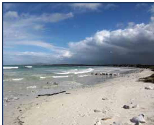
Afrikaanse Pinguin - Stranden Zuid Afrika