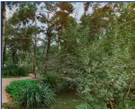
Ringstaartmaki - Madagaskar – bomen